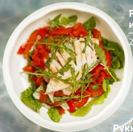
Романо с маринованным перцем и кальмаром