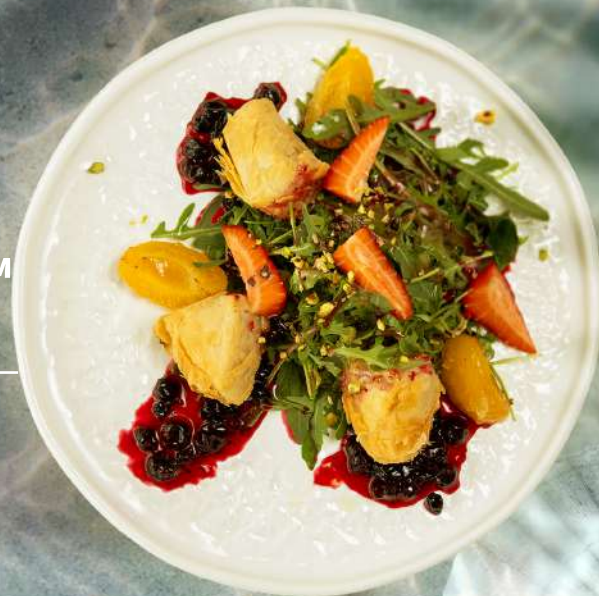
Руккола с хрустящим камамбером, абрикосами и ягодами